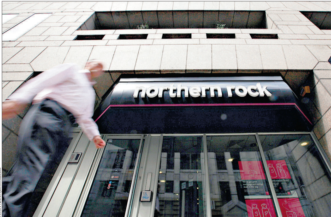
En février 2008, Northern Rock est nationalisée. Les banques européennes seront surveillées. ARCHIVES

Trois autorités européennes de surveillance, derniers recours au-