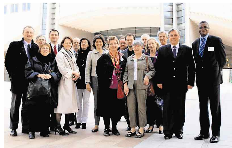
Le réseau de correspondants de l'eurodéputée (au centre de la photo) au siège de la commission à Bruxelles.

L'eurodéputée MoDem de l'Ouest veut rapprocher l'Europe du citoyen. Elle en prend les moyens.